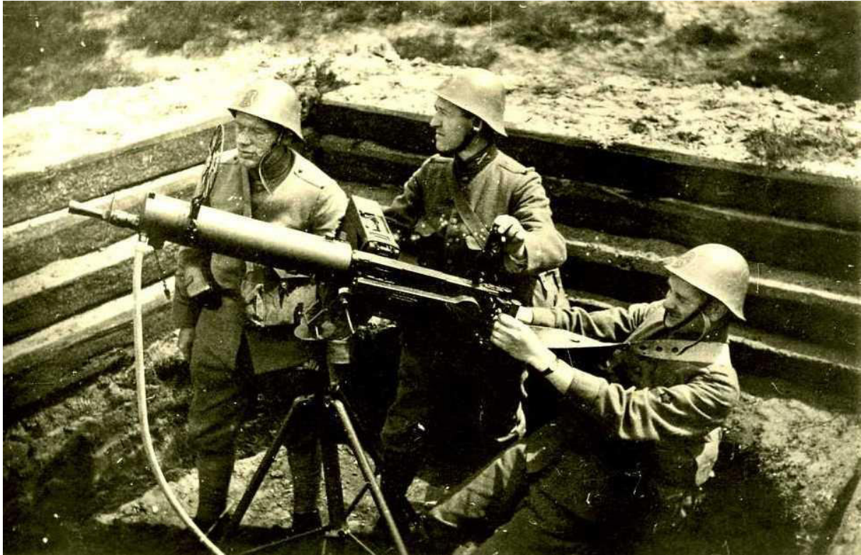
De watergekoelde Spandau mitrailleur M25