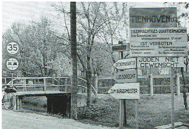
Geleidelijk aan liet de bezetter het masker vallen.