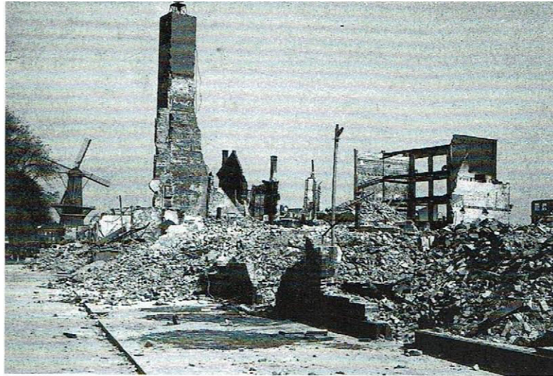
Wat er van Hertzberger's confectiefabriek overbleef na het bombardement op Rotterdam.

De volgende dag is het echtpaar naar Rotterdam gereden. Hun huis was onbeschadigd. Er was niets ontvreemd. Hun fabriek echter was totaal verwoest.